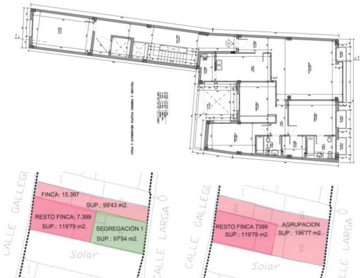
Imagen 2. Comparación de las construcciones en la Segregación N°1. Agrupación de la Segregación N°1 con la finca con Referencia Catastral 7246811WH8174N0001TB.

SEGUNDO.- Comunicar el presente Acuerdo al Área de Urbanismo, Vivienda y Medio Ambiente.