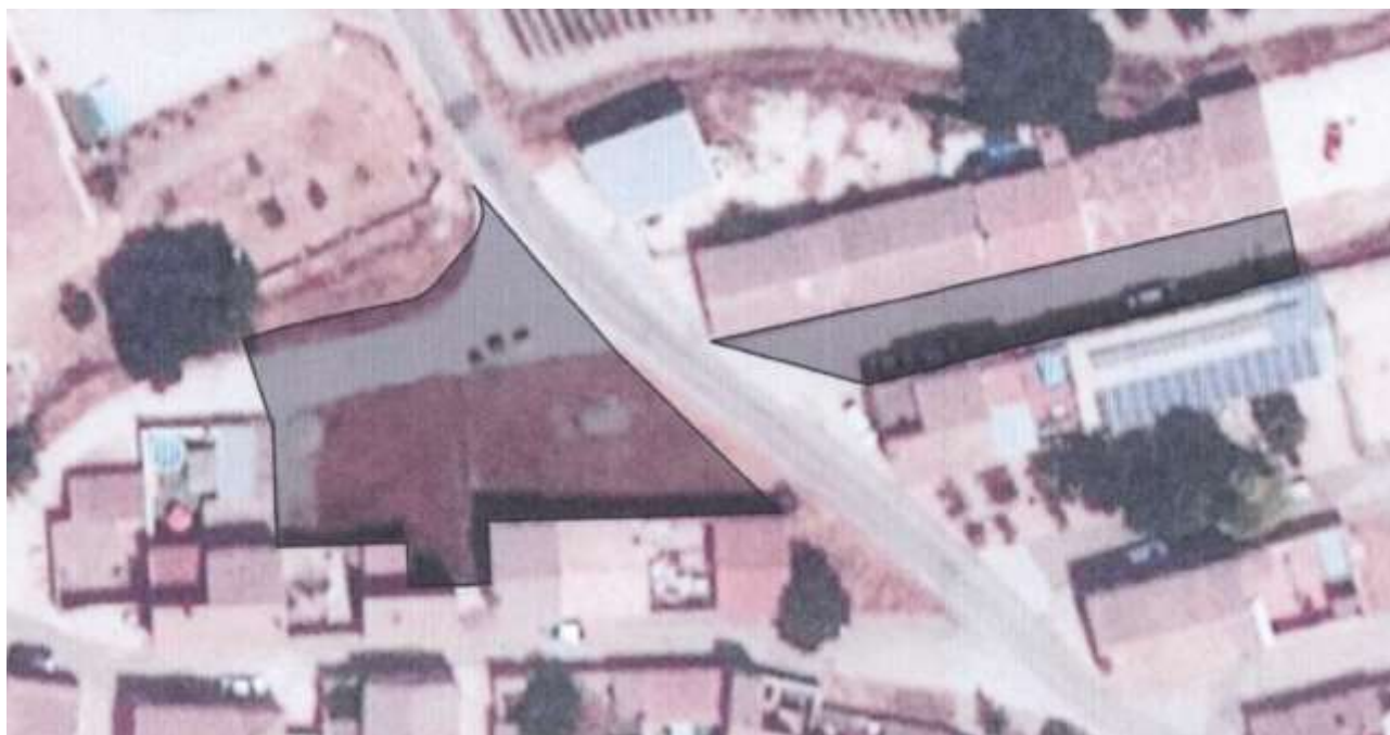
Imagen 1. Finca Matriz objeto de segregación sobre ortofoto de Catastro.