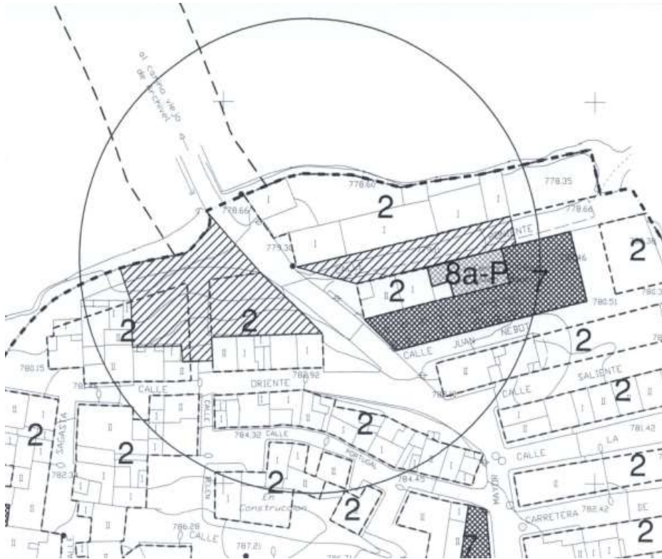
Imagen 2. Finca Matriz objeto de segregación sobre PGMO de Caravaca de la Cruz.

Según documentación aportada, a finca 13.810 Caravaca de la Cruz (CRU 30001000066479) que se pretende segregar, está formada por dos referencias catastrales 3532301WH9133S0001ZU y 3532313009193S0001PD.