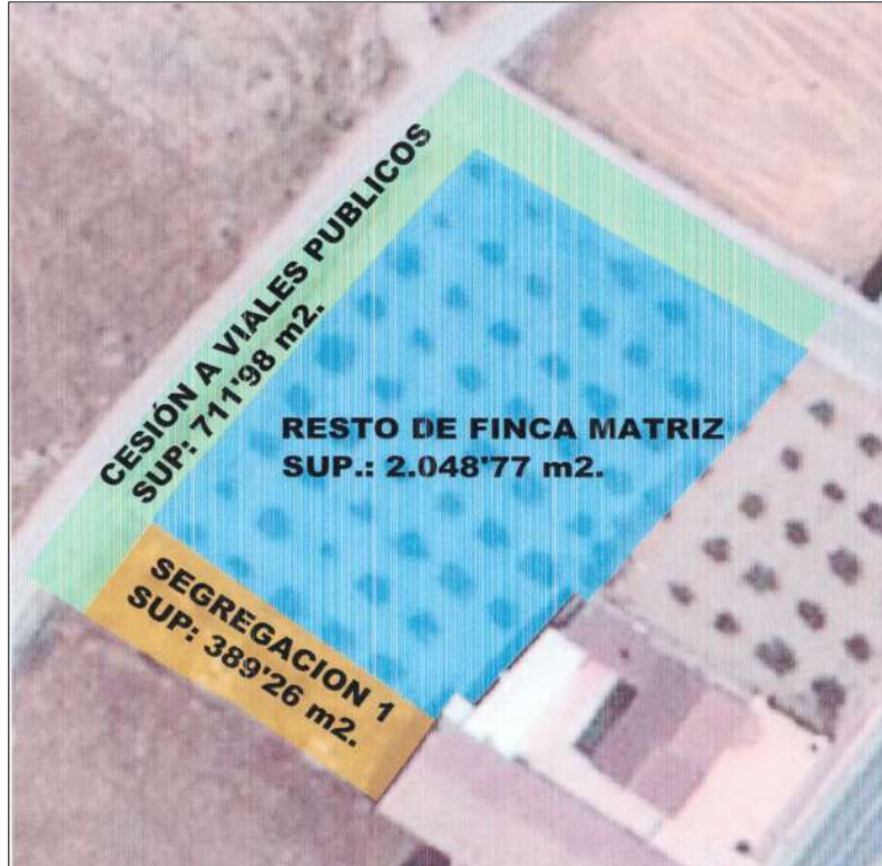
Imagen 2. Segregación propuesta de la Finca Matriz.

SEGUNDO.- Notificar el presente acuerdo al interesado, indicándole que el mismo puede ser objeto de los Recursos que procedan.-