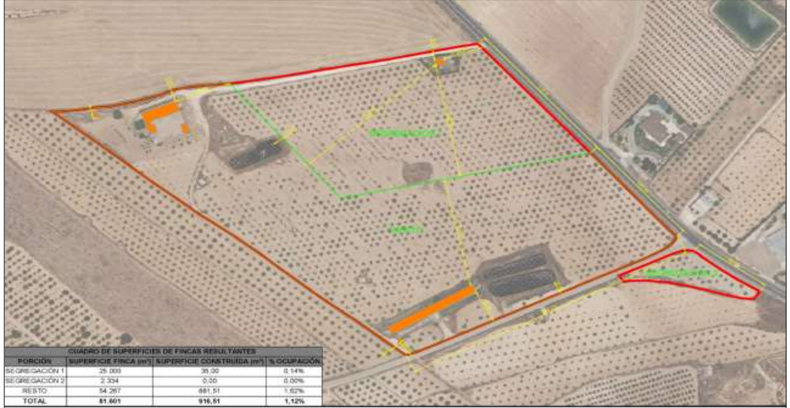
Imagen de parcelación resultante.

Señalar que las construcciones para uso ganadero existentes en la finca matriz fueron objeto de licencia de actividad mediante el expediente 35-2012 CAL, para una explotación porcina con capacidad para 2.500 plazas. Con la segregación solicitada, la actividad ganadera queda asociada al resto de la finca matriz, sin alteraciones en su operativa ni incumplimientos en los requisitos establecidos en el PGMO de Caravaca. Asimismo, la proporción de las construcciones con la superficie y la naturaleza agraria de la explotación cumple con los parámetros contemplados, de acuerdo con el informe de la Dirección General de Producción Agrícola, Ganadera y Pesquera.