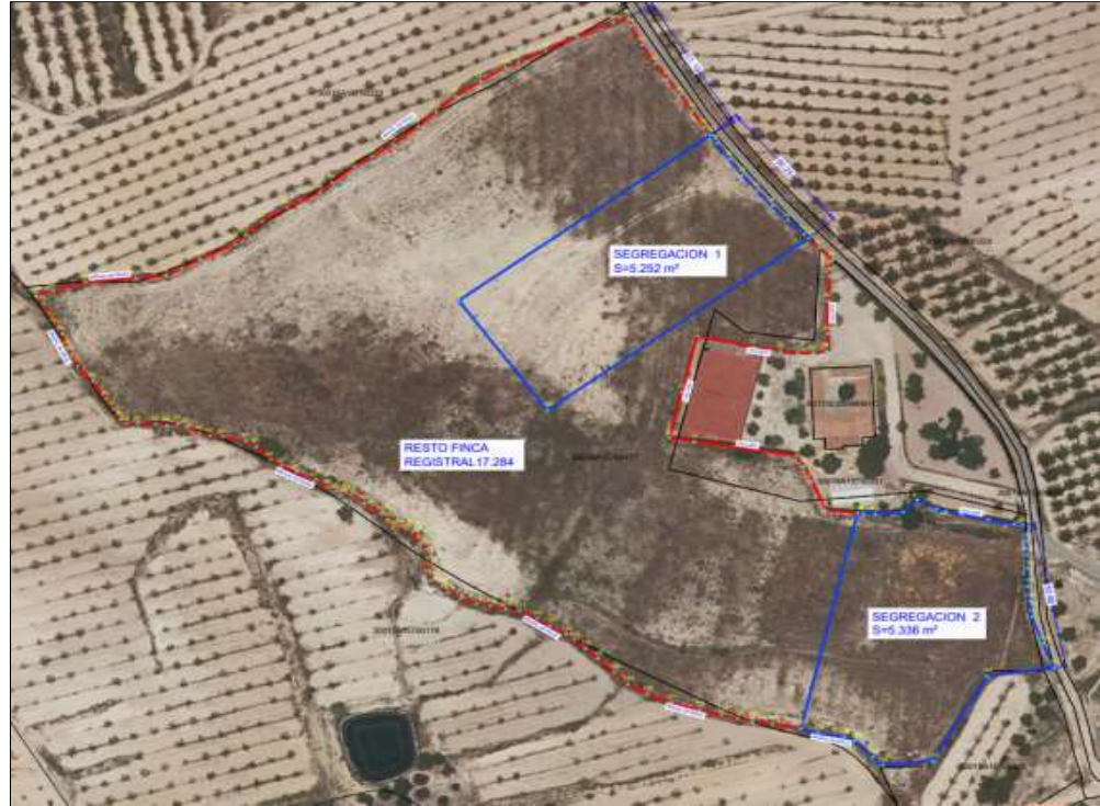
Imagen 2. Fincas resultantes tras segregaciones solicitadas.

NOTA: La nueva parcelación queda georreferenciada mediante el Informe de Validación Gráfica frente a Parcelario Catastral (IVG) que se aporta con el siguiente CSV: