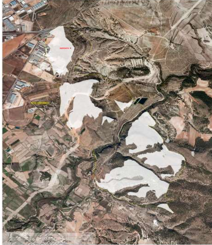
Fig. 1 En blanco se representan las áreas del sitio histórico del estrecho de las Cuevas de la Encarnación desde las que será visible el depósito.

3.3 Las actuaciones arqueológicas preventivas deberán ser sufragadas en su totalidad por el promotor de las obras, con independencia de las ayudas que las administraciones puedan arbitrar puntualmente (art. 59.1 de la LPCRM). Por ello, el "Proyecto de mejora del abastecimiento a pedanías de Caravaca" deberá consignar estas actuaciones presupuestariamente antes de su licitación. Del mismo modo, el apantallamiento vegetal del nuevo depósito deberá también quedar incluido en la memoria del proyecto y en su presupuesto.