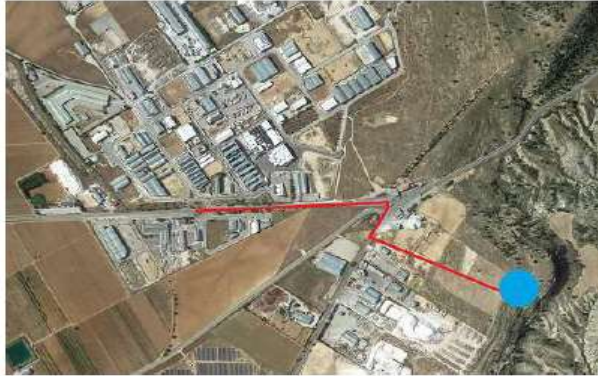
Propuesta de conexión depósito – polígono Cavila.