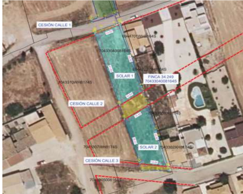
Imagen 3. Detalle de segregaciones propuestas del Trozo nº3.