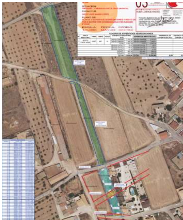
Imagen 2. Fincas resultantes.