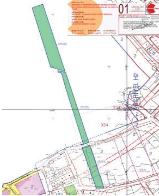
Imagen 1. Finca Matriz Sobre PGMO