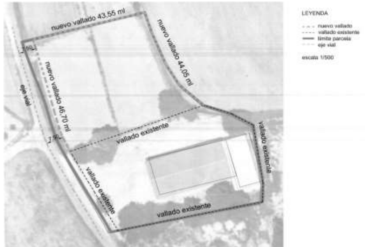
Imagen 3: Propuesta de vallado