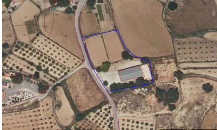
Imagen 2: Situación de la parcela en montaje de ortofoto sobre catastro