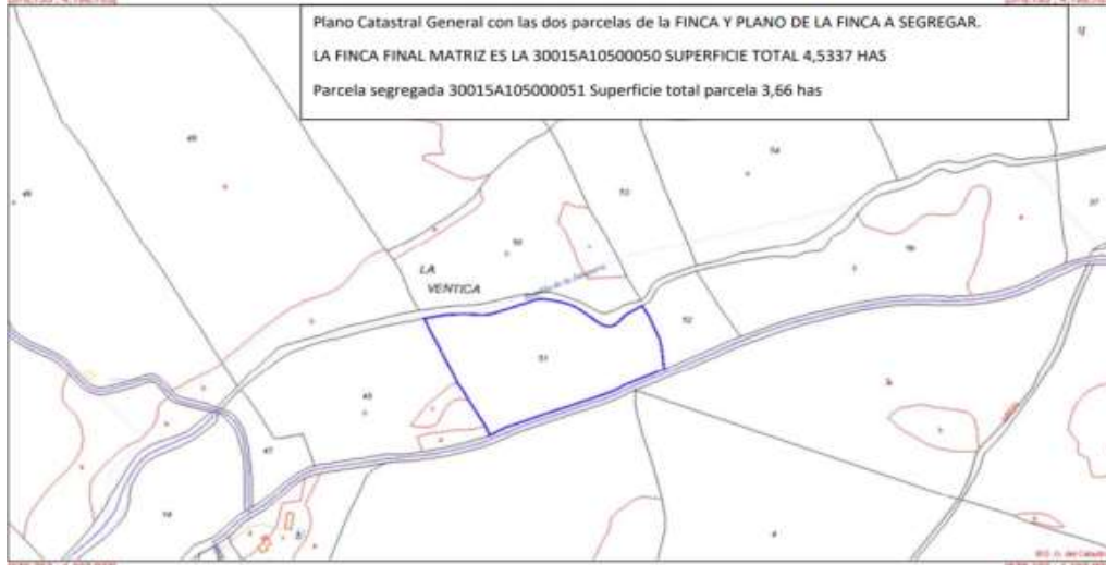
Imagen 2: Extraída de los planos que acompañan a la solicitud de segregación, que muestra la parcela cuya segregación se solicita.